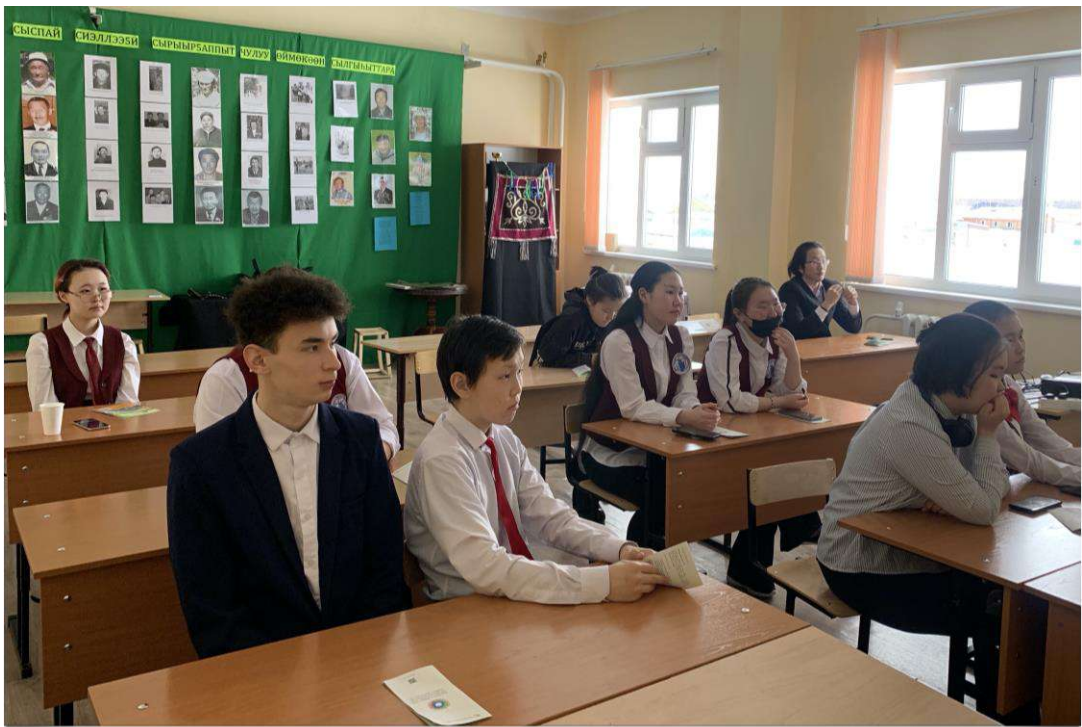
Проориентационные классные часы практикантов