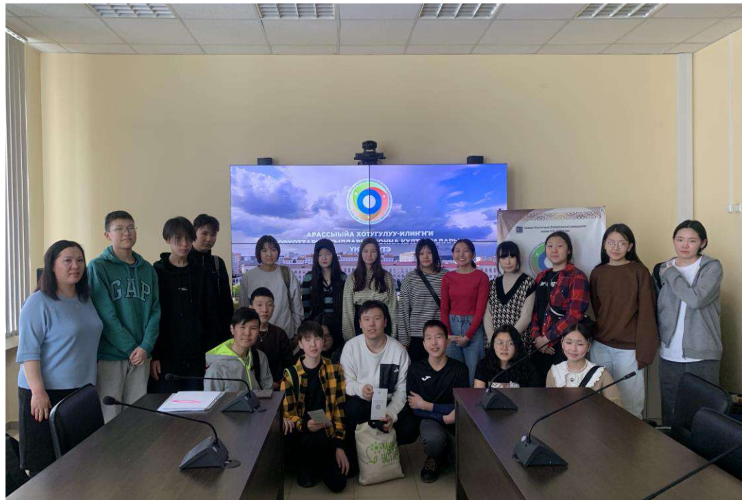
Ежемесячные онлайн-встречи с улусами