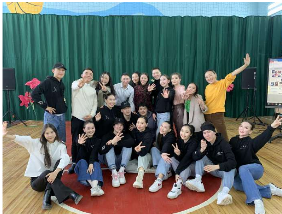
Творческие коллективы: «Уран», «Кюндэл», факультативы и др