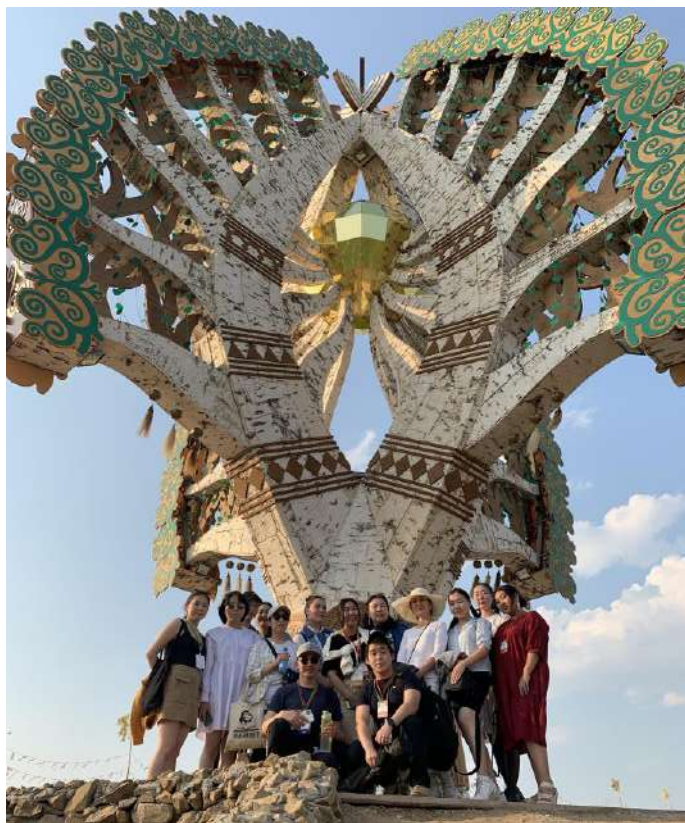
Работа в фольклорных конкурсах